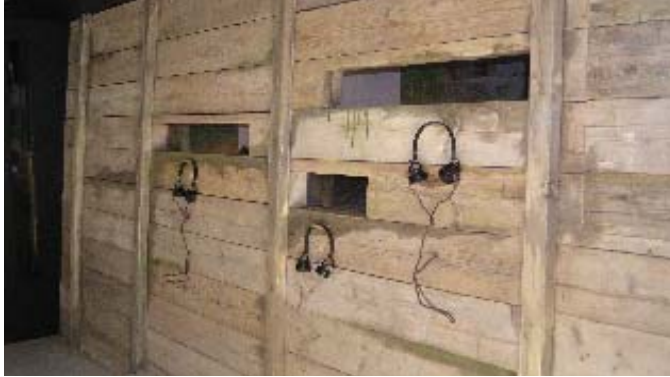
Een loopgraaf in de tentoonstelling gunt de bezoeker een blik op de strijd.

Het ereveld Grebbeberg en het informatiecentrum op het ereveld zijn dagelijks van 9.00 tot 17.00 uur toegankelijk. Op zaterdagen, zon- en feestdagen is er geen beheerder aanwezig.