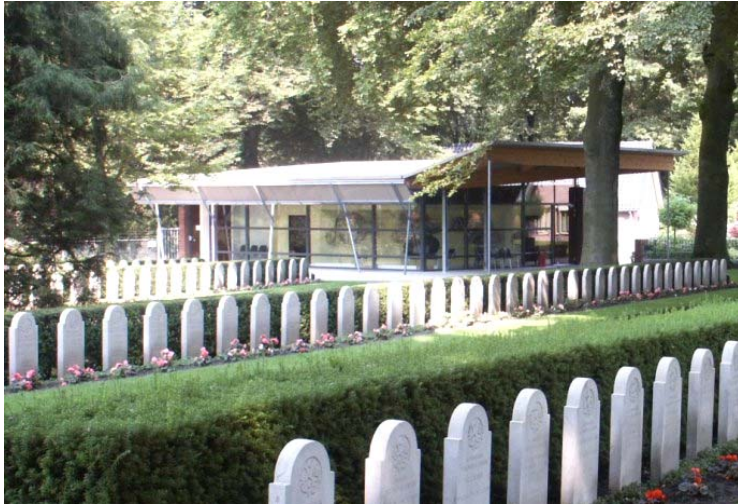
Het informatiecentrum.

In 2005 is in het informatiecentrum op het militair ereveld Grebbeberg de permanente tentoonstelling geopend ' Daar spraken wij nooit over '. Bij deze tentoonstelling is een educatief programma ontwikkeld voor leerlingen van de basisvorming vmbo, havo en vwo. Het programma gaat uit van een bezoek aan het militair ereveld, de