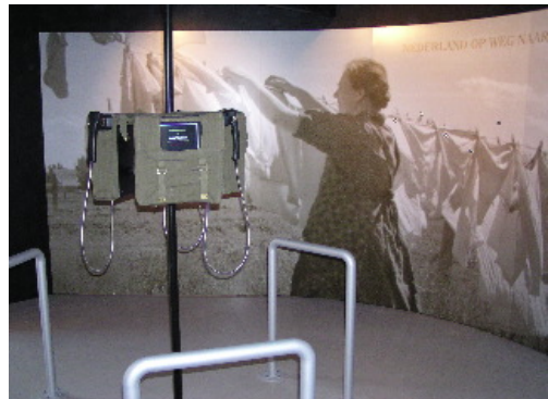
De drie hoofdpersonen geplaatst in hun tijd: vredig Nederland in het interbellum.

In de tentoonstelling staan de persoonlijke films letterlijk centraal; er omheen wordt de historische context weergegeven. Op deze wijze worden de drie personen en hun verhalen 'in hun tijd geplaatst'.