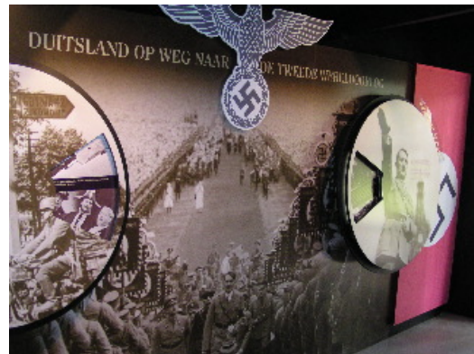
Oorzaken die leidden tot WO-II.

Deze doelen zijn gerelateerd aan de kerndoelen basisvorming geschiedenis die in 1998 zijn vastgesteld. Relevante kerndoelen uit deze lijst zijn: